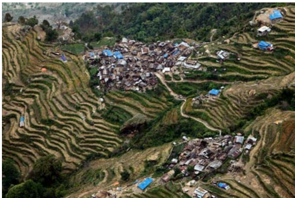
震央に近いネパール中部ゴルカ地方で被害を受けた村